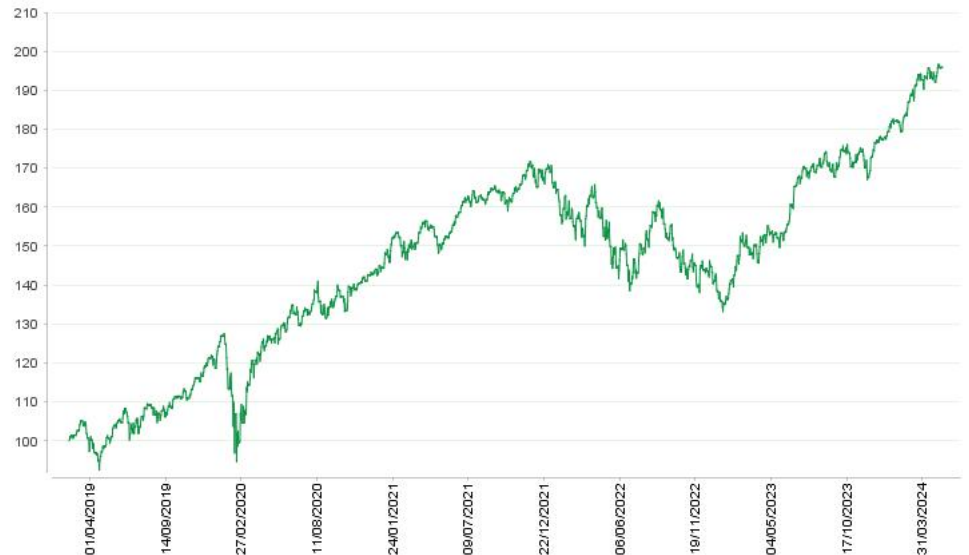
El gráfico muestra la evolución del fondo en los últimos 5 años o desde el último cambio de política, si fuese inferior.

Rentabilidades pasadas no garantizan rentabilidades futuras