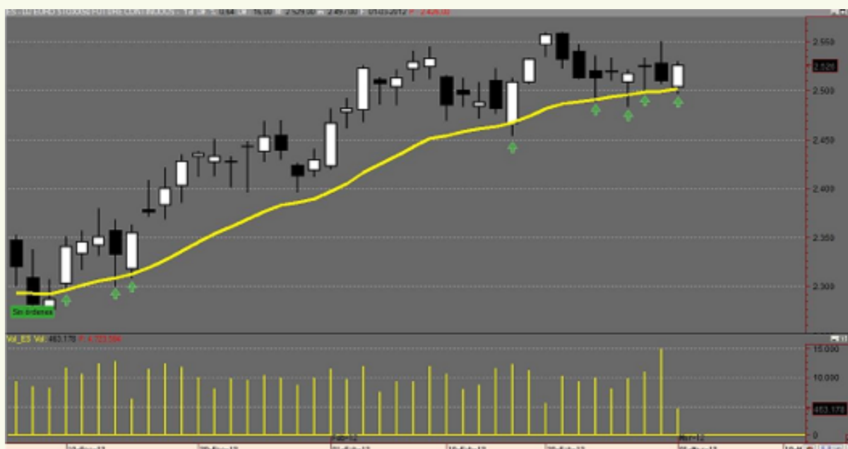
Gráfico futuro del Eurostoxx

En referencia al Eurostoxx estamos siguiendo su tendencia claramente alcista y mientras no pierda los 2500 puntos con fuerza no veríamos un escenario de corrección. Esa cota de los 2500 está marcada por su media móvil de 20 sesiones en gráfico diario, que en caso de perderla, el propio sistema activaría el aviso de priorizar las posiciones cortas.