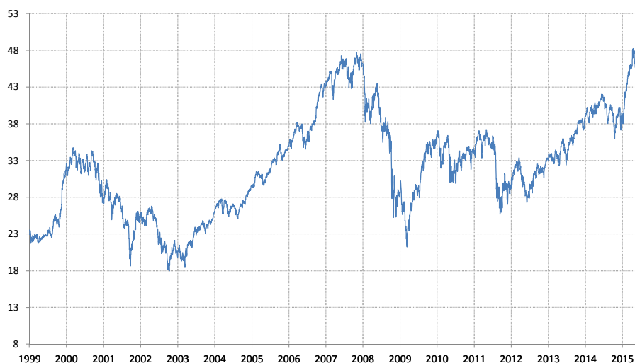
Tabla de Comportamiento